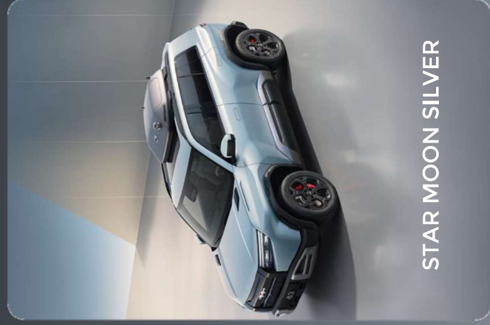
STAR MOON SILVER