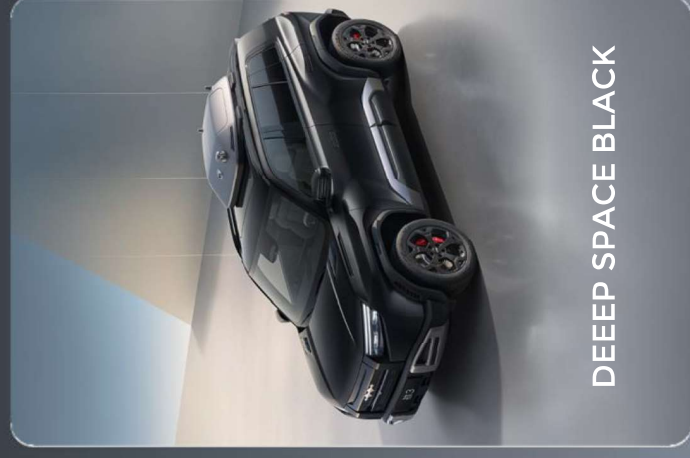
DEEEP SPACE BLACK